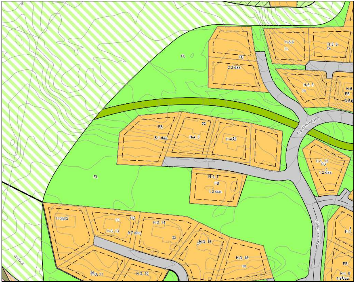
Utsnitt av gjeldende områdeplan for Skei sør